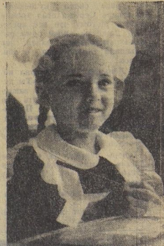
г. Москва, школа № 172.