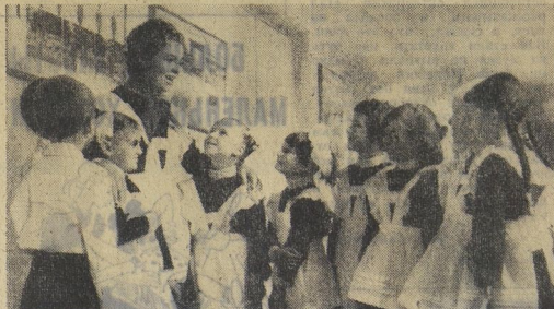
г. Днепропетровск, школа № 79.

Конечно, сейчас ребята уже не выглядят так провинно. Первоклассники успели повзрослеть. Они привыкают к труду, начаты первые тетрадки, перевёрнуты первые страницы учебников. Счастливого пути, первоклассники!