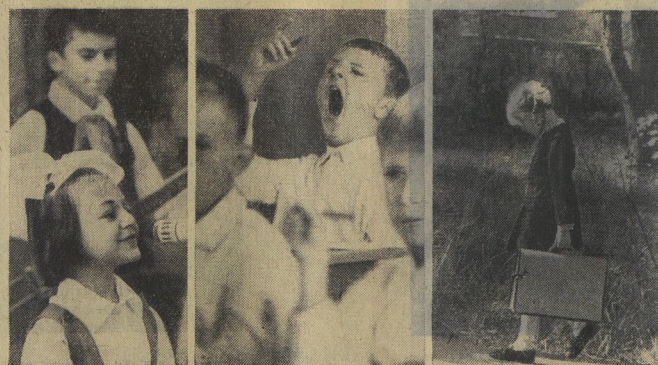
Ансамбль «Маленькие джигиты» поёт о сонце.